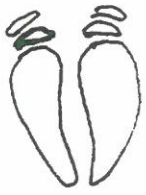
La dimension des empreintes vous renseigne sur la taille de l'animal, marcassin ou adulte.