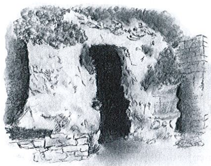
Cruzal, ancienne habitation troglodyte

Capitelle, montée en pierres sèches, servant autrefois d'abri aux bergers ou d'entrepôt pour les outils