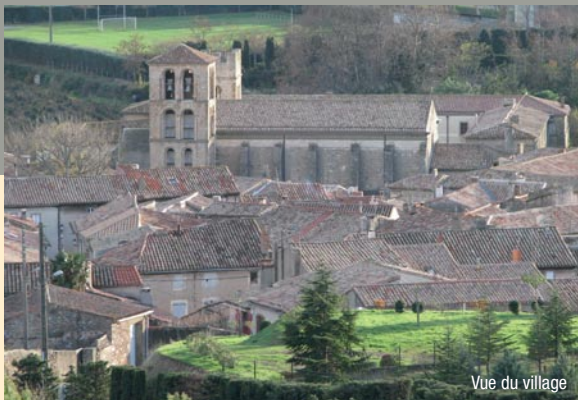
Vue du village

la route dite de Napoléon (remarquer l'ouvrage bâti des ponts) ⑤. Atteindre la route forestière des Rives Hautes, la couper (capitelle) à l'entrée du sentier qui rejoint à travers la garrigue la Carrière du Roy ⑥. Rejoindre le chemin qui mène aux carrières actuelles⑦. Descendre sur 200 m en direction de Caunes-M vois . Prendre à gauche un petit sentier à travers la pinède. Emprunter sur la droite pour rejoindre le village par le chemin du Cros.