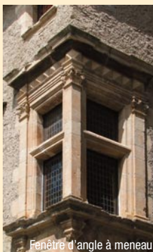
Fenêtre d'angle à meneau

Carrières de Marbre : La cité de Caunes Minervois, connue pour son Abbaye dont le chevet roman est l'un des plus beaux du Languedoc, l'est également pour son fameux marbre rouge incarnat.